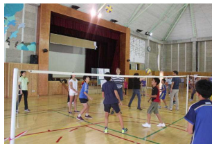
高学年の試合の様子