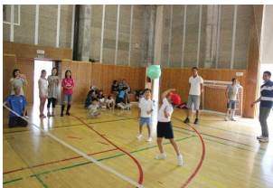
低学年の試合の様子